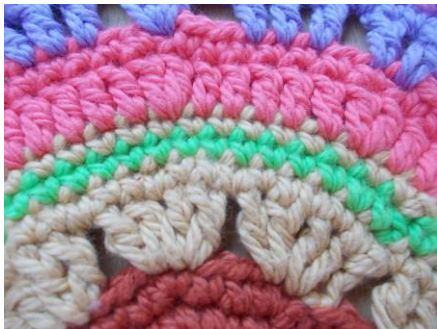
Bild zu Runde 9 - 10